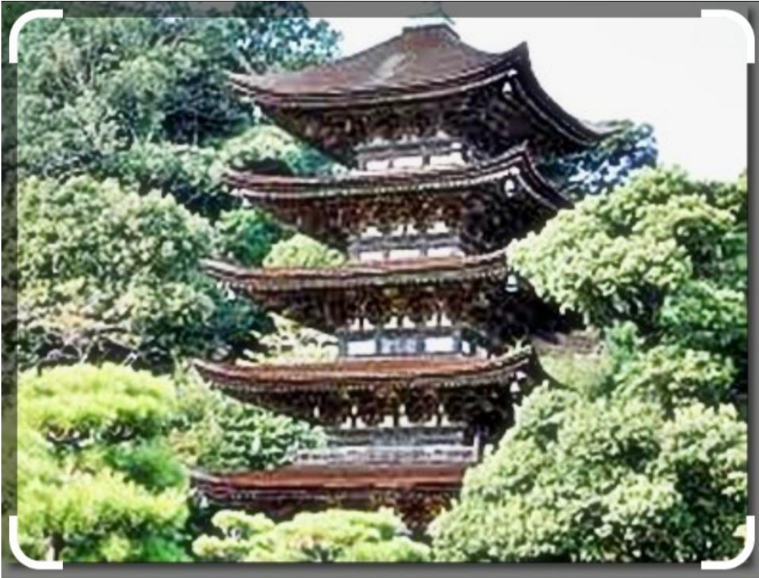
헤이안 시대의 기념물의 유사인 다이고지