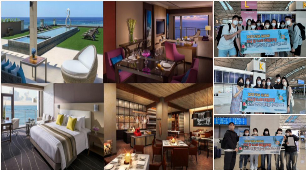
미국 괄 5스타 초특급호텔 전경 및 2022년도 여름/겨울 출국 호스코 회원님들 사진

최고의 서비스 정신으로 고객들을 사로잡고 있는 전세계체인 인터내셔널 호텔그룹의 괄 5스타 호텔입니다. 괄의 유일한 5스타 호텔인 이 곳은 태국을 중심으로 전 세계의 체인호텔을 직접 운영하고 있으며, 최고급 맞춤형 고객서비스를 제공합니다. 모든 호텔에서 동일하게 체험할 수 있는 최고급 World class hospitality를 통한 고품격 맞춤서비스를 배울 수 있습니다.